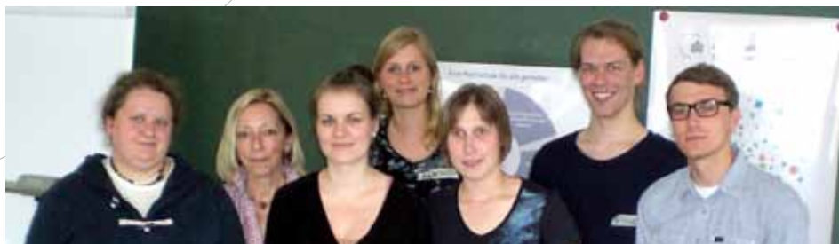
Das Team "Eine Universität für alle"

Unser Projekt hat praktisch bewiesen, dass dies funktioniert, wenn insbesondere die Barrieren in den Köpfen der Menschen als Hindernis erkannt und abgebaut werden.