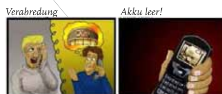
Abb.1: Teile des verwendeten Comics

Aufgabe der Jugendlichen ist es, sich beim Versprachlichen dieses Comics selbst aufzunehmen, z.B. mit Hilfe ihres eigenen Mobiltelefons. Mit diesen