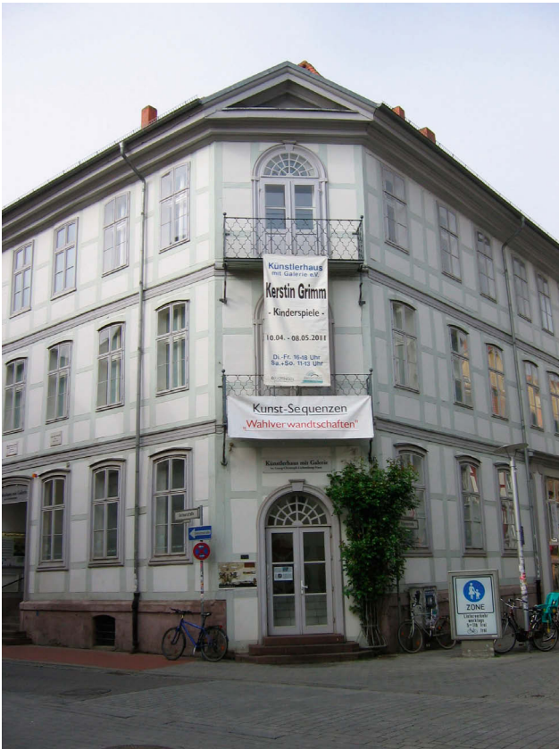
Abb. 2. Göttingen: Balkon des Hauses Gotmarstraße 1, dem Lichtenberg-Haus, wo Humboldt am 15. September 1837 seine Ansprache anlässlich des 100-jährigen Universitätsjubiläums hielt.

liebvollen Dankgefühle dar.' Ein neues lautes Lebehoch war die Antwort, womit die Menge den verehrten Mann begrüßte. Noch einmal dankte er für diese Huldigung, und ließ, gelehnt an die Flügelthür des Balcons, die jubelnde Menge an sich vorüberziehen. Sie begab sich darauf, unter Vortritt der Musik, auf den Markt, wo mit einem academischen Liede das Ganze beschlossen wurde. Bei allen folgenden Festlichkeiten war Alexander von Humboldt als einer der gefeiertsten Gäste anwesend (Säcular=Feier 1838, S. 12f).