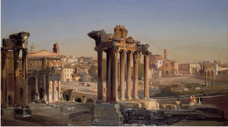
Abb. 6: Ippolito Caffi, Foro Romano (1841). Museo di Roma, MR5681. Öl auf Papier (auf Leinwand), 29x45 cm.

Das politische Programm, eine neue, starke katholische Identität zu fördern, die der nationalen italienischen Identität widerstehen würde, erreichte ihren Höhepunkt unter Papst Pius IX., dessen Pontifikat von den Italienischen Unabhängigkeitskriegen geprägt wurde. Letztendlich musste Pius IX. zusehen, wie die italienischen Truppen am 20. September 1870 mit Hilfe des Durchbruchs bei der Porta Pia Rom einnahmen. Schon im Februar 1849 hatte der Papst Rom verlassen müssen, als dort die „Zweite Republik“ ausgerufen worden war – regiert von einem Triumvirat (Armellini, Mazzini, Saffi). Diese Republik hatte ein noch kürzeres Leben als die Erste, denn schon im Juli 1849 war sie gescheitert. Nichtsdestoweniger hatten diese wenigen Wochen ausgereicht, um das Forum Romanum als Symbol der Republik und der Freiheit wieder ins Zentrum des politischen Diskurses zu rücken. Unter den ersten Ankündigungen der Triumvirn war auch, dass sie ein systematisches Grabungsprojekt auf dem Forum fördern wollten. 76 Das Einzige, was erreicht wurde, war aber die Entfernung der Bäume, die den Weg zwischen dem Titus- und dem Septimius Severus-Bogen flankierten und 1855 wieder eingepflanzt wurden.