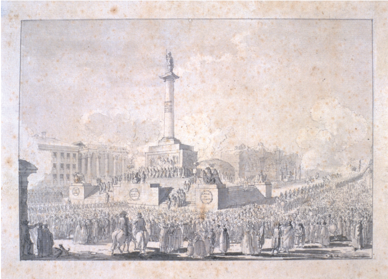
Abb. 4: David-Pierre Humbert de Superville – Sebastiano Ittar, Monumento eretto nel Foro Romano per la celebrazione del primo anniversario della Repubblica Romana il 15 febbraio 1799. Museo Napoleonico, MN696. Zeichnung.

Die Konstruktion bestand aus einer Säule, die eine Freiheitsstatue trug, auf deren Podest vier Adler standen; dahinter befand sich als Kulisse die Maxentius-Basilika. Symbolisch entstehen hier die neuen Institutionen (die Freiheit) aus den antiken (den römischen Adlern). Zu sehen waren auch die Porträts von Brutus und Cassius, den Caesarmördern. 50 Am selben Tag wurde zudem das Denkmal für die „Gefallenen der Republik“ eingeweiht: Ein antiker Sarkophag wurde vor der Maxentius-Basilika auf einem hohen Podest mit vier Zypressen an den Ecken aufgestellt (Abb. 5). 51