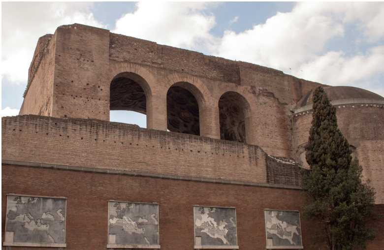
Abb. 8: Die Maxentius-Basilika mit den vier Karten, welche die Expansion des römischen Reiches zeigen.

Bei der Einweihung der Straße, wohl am 28. Oktober 1932, ritt Mussolini auf einem weißen Pferd auf der neuen Straße. 128 Zwei Jahre später, am 21. April 1934, wurden an der Basilika des Maxentius, die sich am Anfang dieser neuen Achse befand, vier große Karten angebracht, welche die Expansion Roms vom kleinen Dorf des Romulus bis zur größten Ausdehnung des Reiches unter Trajan zeigten (Abb. 8).