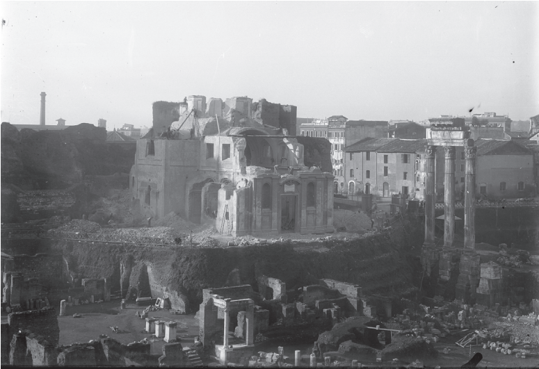
Abb. 7: Fotografie des Abrisses der Kirche S. Maria Liberatrice auf dem Forum Romanum im Jahr 1900. Archivio fotografico Parco Archeologico del Colosseo – MiBAC.

Public domain: https://commons.wikimedia.org/wiki/File:Santa_Maria_Liberatrice_al_Foro_Romano_distruzione.jpg [03.12.2020].