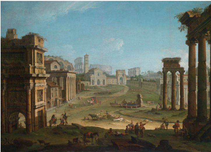
Abb. 2: Antonio Joli (1700-1777), Vista del Foro con il Campo Vaccino, S. Francesca Romana e il Colosseo. Private Sammlung. Public domain: https://en.wikipedia.org/wiki/File:ANTONIO_JOLI_ROME,_A_VIEW_OF_THE_FORUM.jpg [02.12.2020].