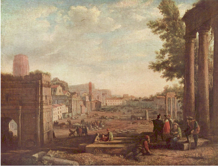
Abb. 1: Claude Lorraine (c. 1600-1682), Campo Vaccino (1636). Musée du Louvre.