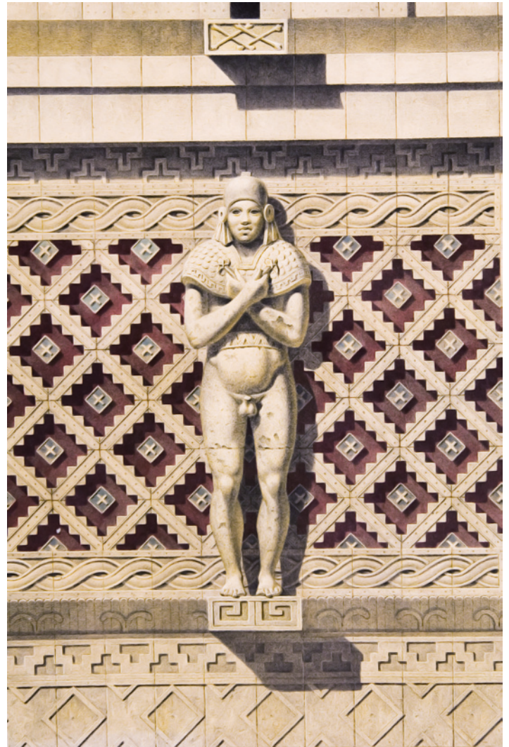
Plancha XIII. Estudio de la mitad de la fachada de lo que Waldeck denomina “Temple du soleil”, en Uxmal, publicado en Voyage pittoresque et archéologique dans la Province d’Yucatan .