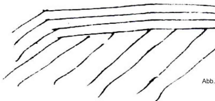
Abb. 1: Geognostische Skizze von der Spitze des Erpeler Ley aus dem Tagebuch von Steven Jan van Geuns (1789).