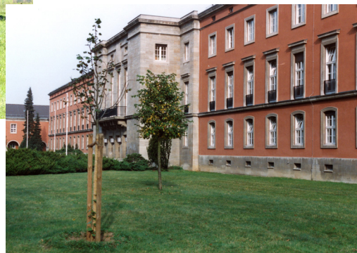
Abb.: Universitätsstandort August-Bebel-Str. 89, Hauptgebäude (Nähe S-Bahn Station Griebnitzsee)