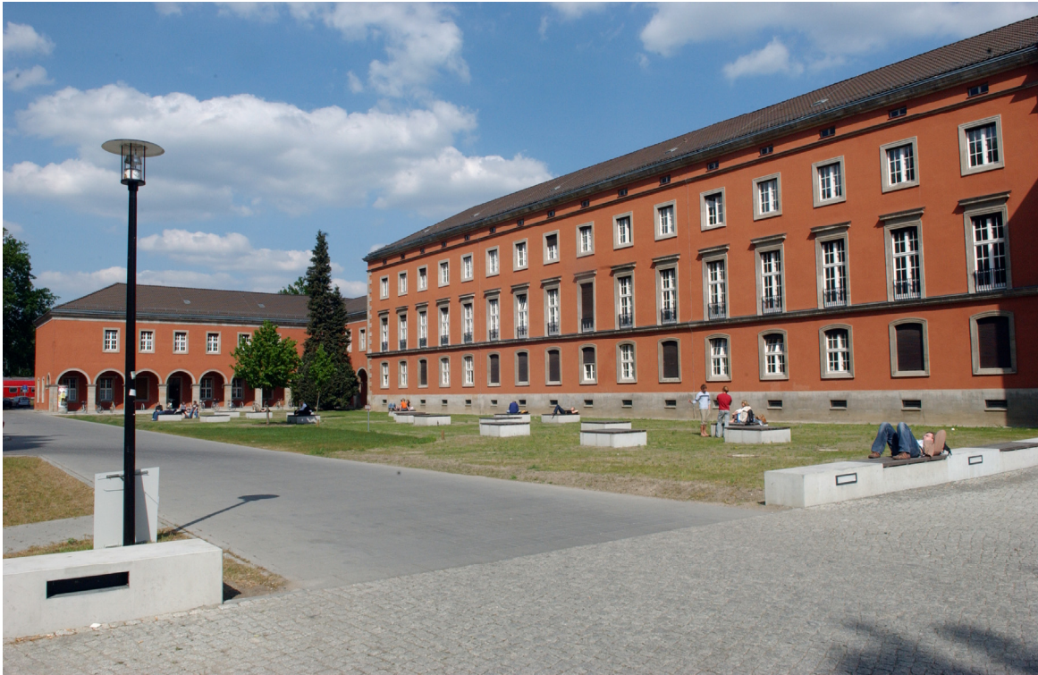
Abb.: Universitätsstandort August-Bebel-Str. 89, Hauptgebäude

Gemäß § 75 Abs. 2 Satz 2 BbgHG steht das MRZ unter direkter Verantwortung der Präsidentin der Universität. Die Veränderungen sind vom Senat beschlossen und in der am 28. Dezember 2001 in Kraft getretenen Satzung festgeschrieben worden.