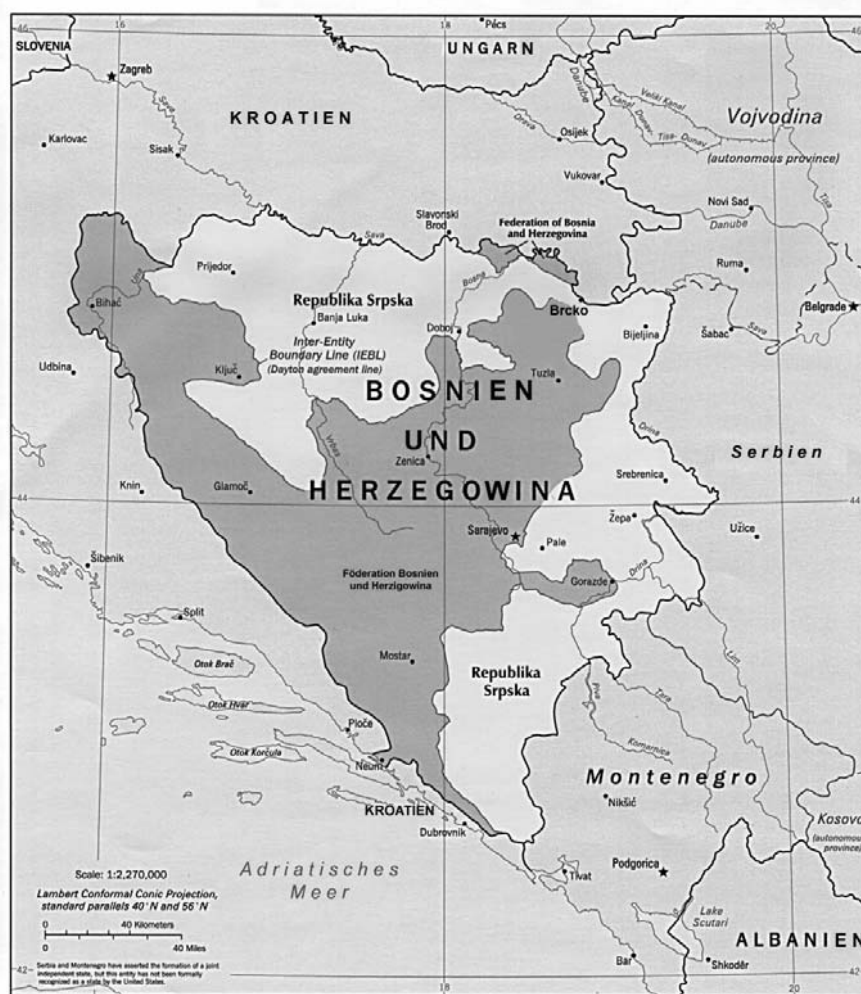
Abbildung 1: Die Entitäten und die „Inter Entity Boundary Line“ in BuH