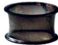
Abb. 8: Ohrpflock aus Obsidian. (H. 3,5 cm, D. 6,2 cm).

Vermutlich wegen seiner Größe wurde der Ohrpflock von Humboldt als Armreif bezeichnet. Er war von der Herstellungstechnik des Objektes beeindruckt. Zu der äußerst feinen Verarbeitung des durchsichtigen Obsidians bemerkt er, daß es außerordentlich schwierig ist, sich vorzustellen, auf welche Weise ein so zerbrechliches Material derart hat verarbeitet werden können. Das vollkommen transparente vulkanische Glas ist zu einem zylindrischen Reifen von weniger als einem Millimeter Dicke geschliffen. „Le bracelet d’obsidienne a été trouvé dans un tombeau indien dans la province de Mechoacan au Mexique. Il est extrêmement difficile de se former une idée de la manière avec laquelle on est parvenue a travailler une substance aussi fragile. Le verre volcanique, parfaitement transparent, est réduit à une lame dont la courbure est cylindrique, et qui a moins d’un millimetre d’épaisseur“. Auf das Etikett schrieb er: „Dieses Armband, sehr alt, ist im Königreich Michoacan/Mexiko in einem indianischen Grab, an Schellen (Cascabeles) gebunden, gefunden worden“ 15 .