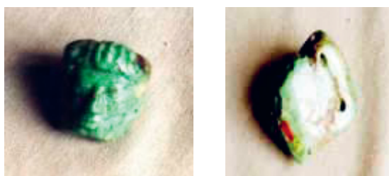
Abb. 9: Steinanhänger (Jade), Vorder- und Rückansicht (4 cm breit, 4,5 cm hoch, 2 cm dick)

Jadeit ( \text{NaAlSi}_2\text{O}_6 ) bildet ein weiß bis grünlich, oft geadertes, fasrig verfilztes zähes Aggregat der Härte 6 bis 7, das seit Alters besonders in Oberbirma und China gewonnen wird. 17 Die von den Spaniern verwendete Bezeichnung der Jade als Stein gegen Nierenleiden (span. Piedra de ijada = Hijada, Kolikstein) ist in ihrer kulturellen Bedeutung als Heilstein identisch mit der für Nephrit. Auch mineralogisch sind die beiden Gesteine sehr ähnlich (siehe oben Jadeext).