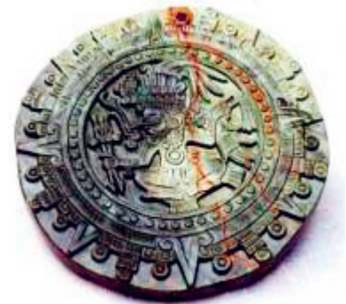
Abb. 4: Sonnenscheibe (Serpentin), Replik (26,9 cm Durchmesser, 2,5 cm dick)

Ein weiteres von Humboldt erworbenes Kulturobjekt aus grünem Stein (Serpentin) war eine Sonnenscheibe mit der Reliefdarstellung des Sonnengottes Tonatiuh im Strahlenkranz 8 (Abb. 4).