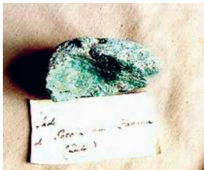
Abb. 1: „Jade“ (Fuchsit), Paccha

als Fuchsit identifizierten Proben (Fuchsit/Muskovit 1998 bestimmt) haben folgendes Etikett: Jade, Paccha b. Zaruma, Prov. El oro, Loya, Quito, A. v. Humboldt.