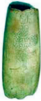
Abb. 3: Jadeaxt (Nephrit), Replik (8,3 cm breit, 20,6 cm lang, 3,4 cm dick)

Humboldt bemerkte zu der Axt “(d’un feldspath compacte (dichter feldspath) qui passe au vrai jade de Saussure“ 5 ), daß die „Jade in den verschiedensten Gegenden der Erde von wilden und halbzivilisierten Völkern als Material zur Herstellung von Äxten und verschiedenen Verteidigungswaffen verwendet worden sei – in Mexiko und Peru sogar zu einer Zeit noch, als man sich längst des Kupfers und der Bronze zu bedienen verstanden und auch bedient hätte“ 6 . Er behauptet, daß – obgleich er das anstehende Gestein nicht vorfand – sich häufig Äxte aus Jade im Boden finden: „Malgré nos courses longues et frequentes dans les Cordillères des deux Ameriques, nous n’avons jamais pu découvrir le jade en place, et plus cette roche paroît rare, plus on est étonné de la grand quantité de haches de jade que l’on trouve presque partout où l’on creuse la terre dans les lieux jadis habités, depuis l’Ohio jusqu’aux montagnes de Chili“ 7 . Er hielt die Jadeaxt als Kulturobjekt nicht für sehr bedeutend, läßt jedoch später eine Zeichnung von ihr anfertigen (Abb. 5).