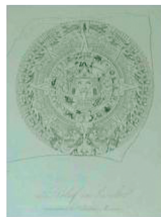
Abb. 6: Vues des Cordillères. Tafel 23, Kalenderstein