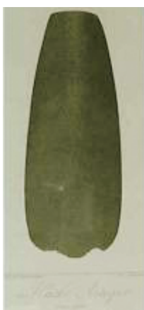
Abb. 5: Vues des Cordillères. Tafel 28, Axt

Unter dem Namen „Atlas Pittoresque du voyage: Vues des Cordillères et monuments des peuples indigènes de l’Amérique“ erschien in Paris 1813 ein von Humboldt als Atlas gedachtes Buch mit Bildern seiner Reise. 14 Neben den Zeichnungen der Jadeaxt (Abb. 5, Aztekische Axt, von Arnold in Berlin gezeichnet und grün koloriert) und des Kalendersteins (Abb. 6, Relief in Basalt, den mexikanischen Kalender darstellend, gezeichnet 1832 von Jean Baptiste Cloquet in Paris) finden sich hierin weitere Kulturobjekte als Zeichnungen publiziert. Sie gehören zu dem in Paris bis 1827 geschriebenen 34 bändigen Reisewerk, das insgesamt mit etwa 1400 Kupferstichen und Zeichnungen illustriert ist.