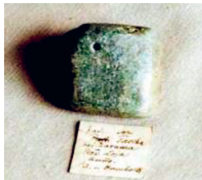
Abb. 2: „Jade“ (Fuchsit), Paccha. Anhänger (3,5 × 3,8 cm)

Für Humboldt waren die Stücke primär geologisches Untersuchungsmaterial. So wurde geklärt, daß sich der smaragdgrün gefärbte Fuchsit mit der Härte 2 bis 4 als Umwandlungsprodukt chromhaltiger Olivingesteine bildet und der leicht spaltbaren Glimmergruppe angehört. Benannt wurde er nach dem Mineralogen Johann Nepomuk von Fuchs (1774–1856).