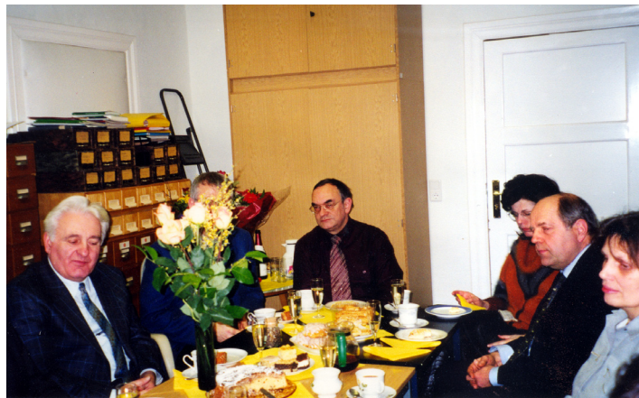
Abb. 4. Die Mitarbeiter der Alexander-von-Humboldt-Forschungsstelle am 11.1.2001